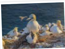
BASSTÖPEL MIT KÜKEN