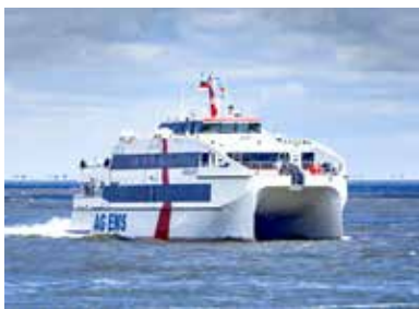
HSC „NORDLICHT II“