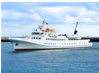
MS „FUNNY GIRL“