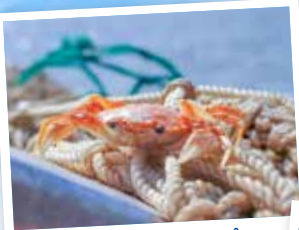
KREBS ODER KRABBE?