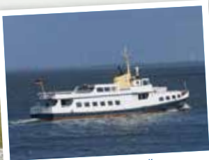
MS „OL BÜSUM“

Die Seehundsbänke rund um die Insel Trischen – ein einzigartiges Schutzgebiet im Nationalpark Schleswig-Holsteinisches Wattenmeer. Trischen ist unbewohnt und darf nur von wenigen Menschen im Jahr betreten werden. Von Bord aus erleben Sie dieses einmalige Stück unberührter Natur – ein Paradies für Vögel, Seehunde und Naturfreunde.