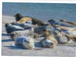
ROBBEN AUF DER DÜNE