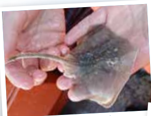
EIN BESONDERER FANG